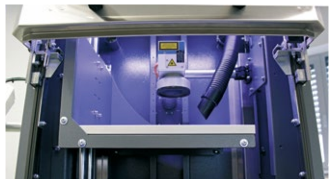
Flexible Platzierung des innenliegenden Absaugschlauches