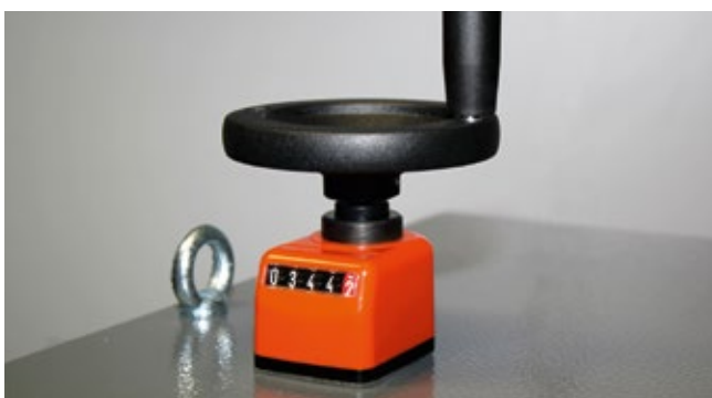
Manuelle Höhenverstellung des Produktaufnahmetisches