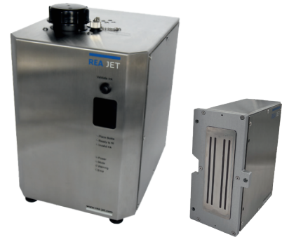
Tintenversorgung mit Schreibkopf